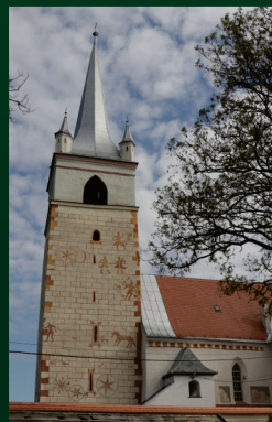
Csíkrákos Kisboldogasszony 11.00 órakor