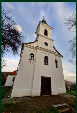
Székelybő Szent Adalbert 13.00 órakor

A GYULAFEHÉRVÁRI RÓMAI KATOLIKUS ÉRSEKSÉG ÉS A TELEKI LÁSZLÓ ALAPÍTVÁNY TISZTELETTEL MEGHÍVJA A FŐEGYHÁZMEGYE TERÜLETÉN A MAGYAR KORMÁNY ÁLTAL LÉTREHOZOTT RÓMER FLÓRIS TERV TÁMOGATÁSÁVAL FELÚJÍTOTT ÖT TEMPLOM