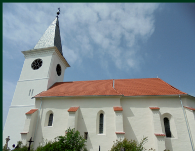
Szentdemeter Nagyboldogasszony 11.00 órakor