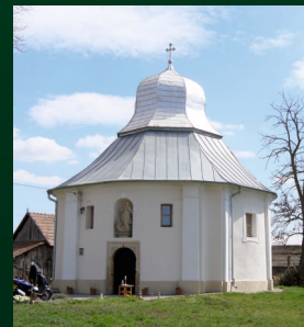
Názna- Marosszentkirály Kápolna 9.00 órakor