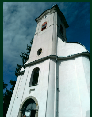
Nagyág Kisboldogasszony 15.00 órakor