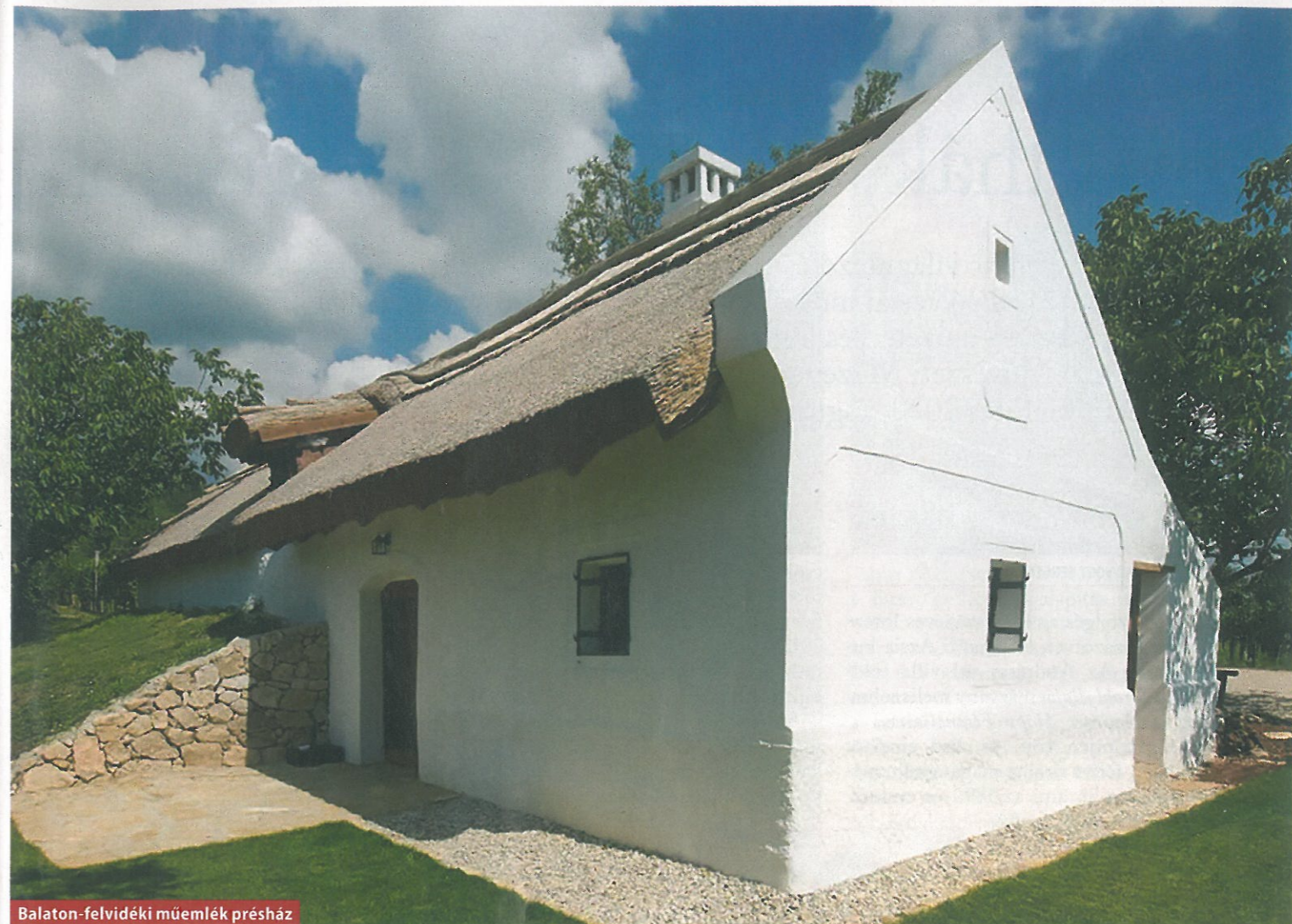
Balaton-felvidéki műemlék présház