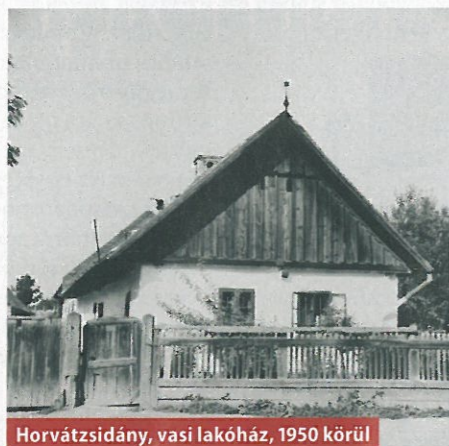
Horvátzsidány, vasi lakóház, 1950 körül

A magyar népi építészeti emlékei persze nem az országhatárhoz, hanem az egész Kárpát-medence jellegzetes tájegységeihez kötődnek, ezért kulturális és építészeti szempontból is sokféle irányt képviselnek. Azt, hogy miből és miként építkeztek a XIX–XX. században, nagymértékben befolyásolták a természeti, földrajzi adottságok, az anyagi lehetőségek és egy adott társadalmi réteghez való tartozás. Így minden ház más-más, más a kapuja, a tornáca és a tető formája is aszerint, melyik