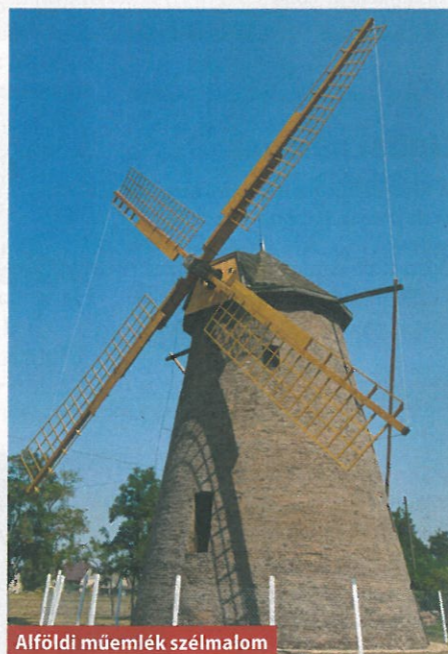
Alföldi műemlék szélmalom

vidékről való. Az Alföldön például a fahány miatt ekkoriban már többnyire sár- és vályogtégglából építkeztek, Erdélyben vagy az Őrségben éppen ellenkezőleg, a borona- és gerendafal a jellemző. Szintén a tájegység határozta meg az épületek elhelyezését is, az Őrségben a lakó- és gazdasági épületek zárt U alakban összeépültek, az Alföldön viszont sokkal nyitottabban kapcsolódtak egymáshoz, és egyes elemek elhelyezésekor a napot és a széljárást is figyelembe vették. Általánosságban elmondható az is, hogy a magaskultúrából ismert építészeti stílusok, elsősorban a barokk, majd a klasszicizmus formajegyei lassan átöröklődtek a népi lakóházakra is. Ez utóbbi leginkább a Balaton-felvidék tornácos házainak kőoszlopain köszön vissza, míg a barokk a világi uradalmakra és egyházi épületekre hatott később is.