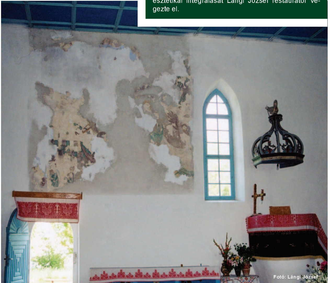
Fotó: Lángi József

A falképek részleges feltárását, konzerválását és esztétikai integrálását Lángi József restaurátor végezte el.