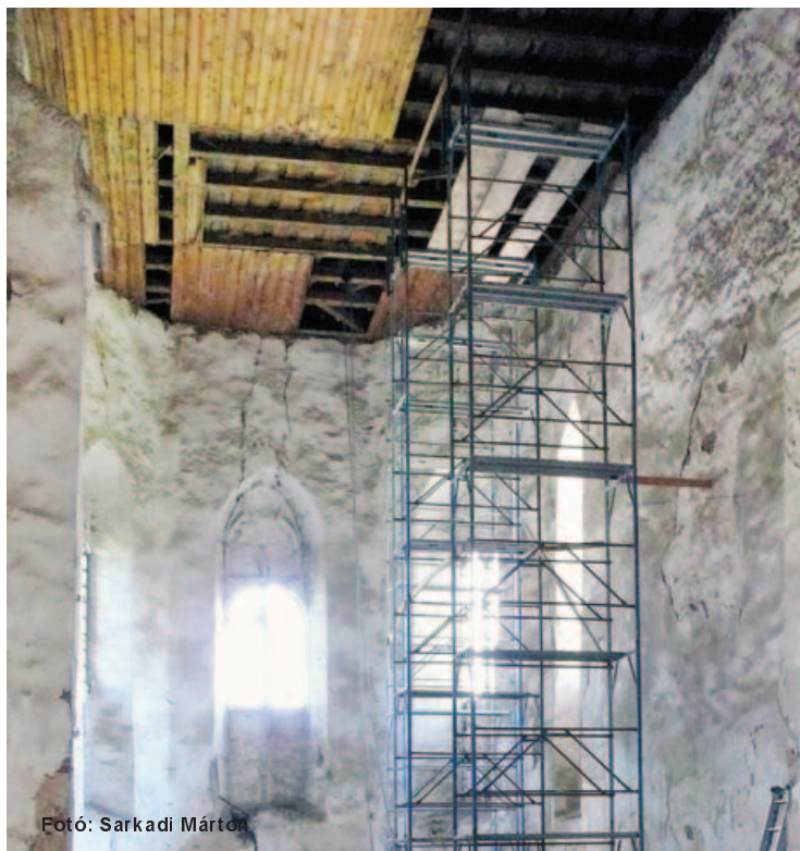
Fotó: Sarkadi Márton

A munkálatokat Sarkadi Márton építészmérnök irányította, a nyílászárókat Király László, a kivitelezést Székely János vállalkozó végezte.