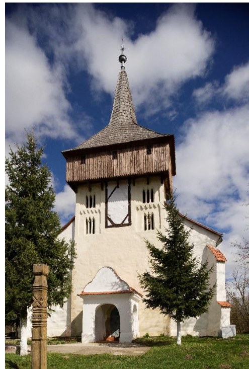
Kükküllővár (Erdély) református templom