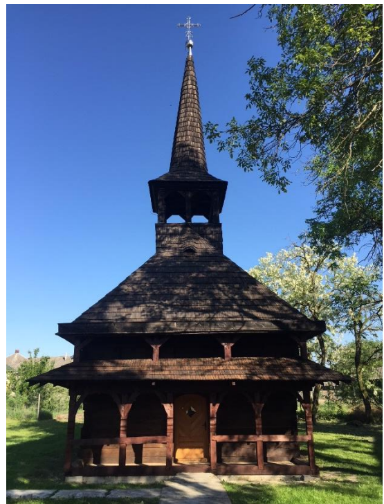
Tiszabökény (Kárpátalja) görögkatolikus templom