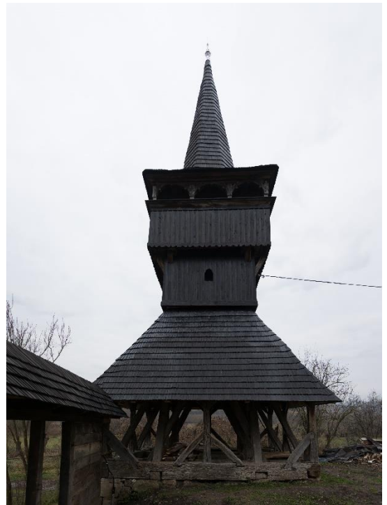
Farnas (Erdély) harangláb