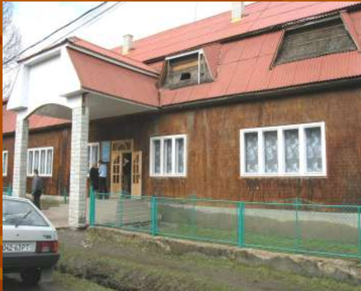
Körösmezői iskola-óvoda épülete