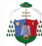
Gyulafehérvári Római Katolikus Érsekség Budapesti Történeti Múzeum Prímási Levéltár, Esztergom