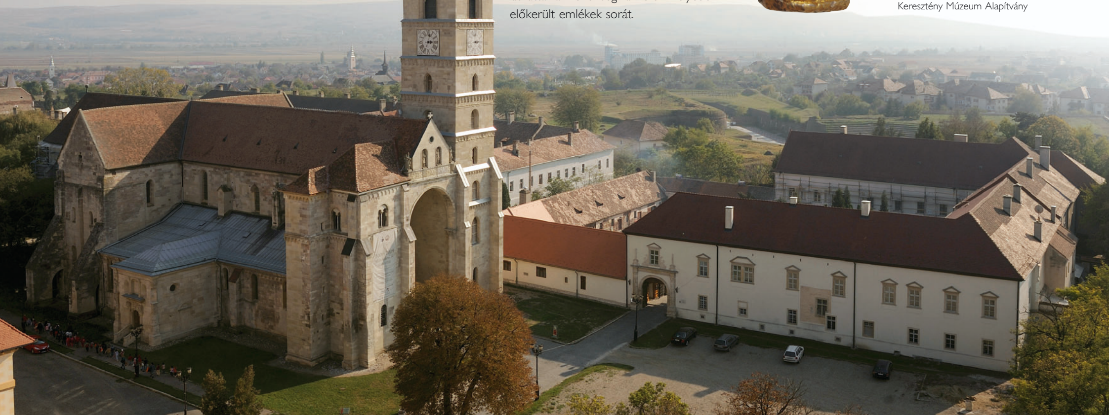
Keresztény Múzeum Alapítvány